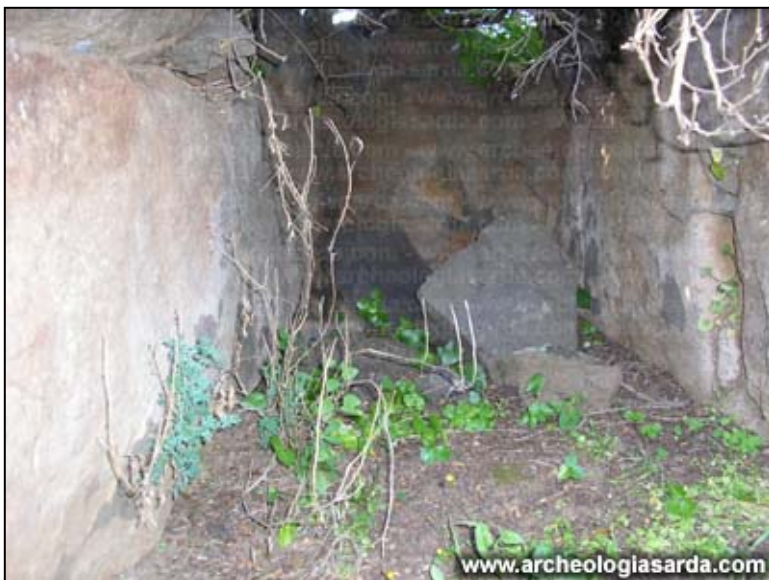
Il corridoio funerario