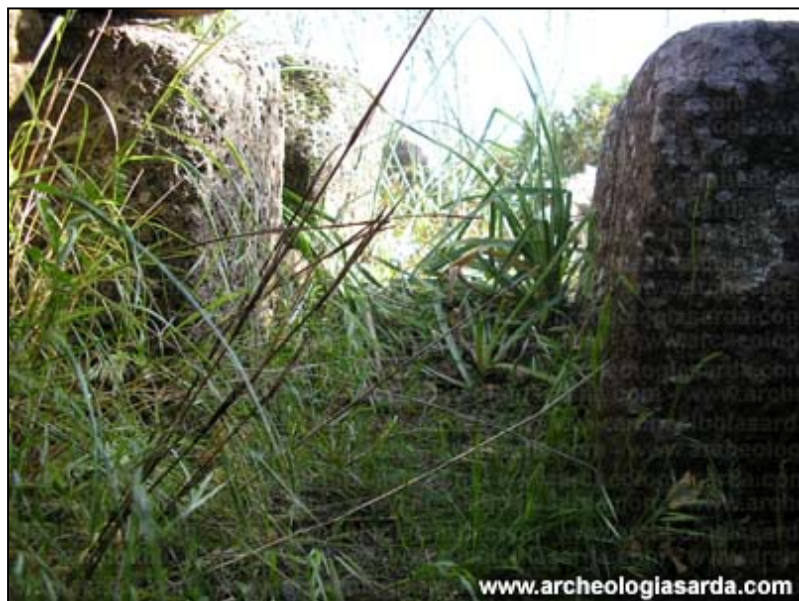
Il portello visto dall'interno.

Se hai Google earth puoi indirizzarlo direttamente sul monumento in questione cliccando qui!