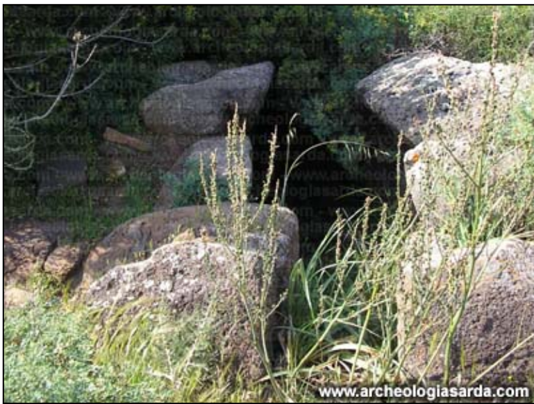
Tomba dei giganti di Campu darè - Portello