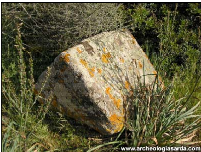
Concio della sepoltura isodoma.